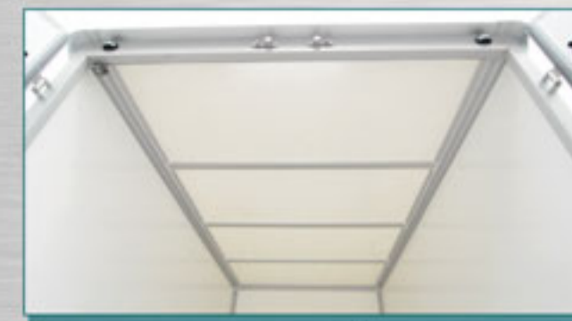
โรสนิม เพราะตัวตู้ไร้รอยเชื่อม