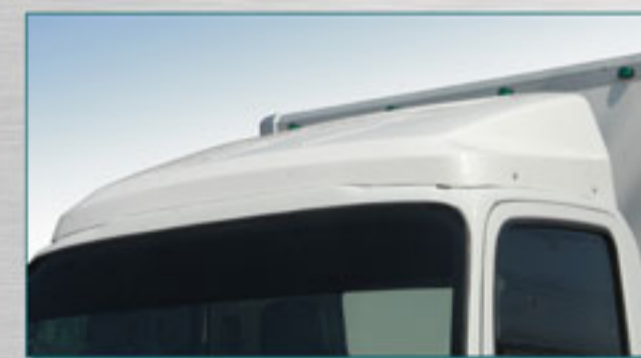
กระบังลมหน้าผลิตจากไฟเบอร์กลาส น้ำหนักเบา สดแรง เสียทาน ช่วยประหยัดน้ำมัน ** (ดูปรนัเสริมพิเศษ)