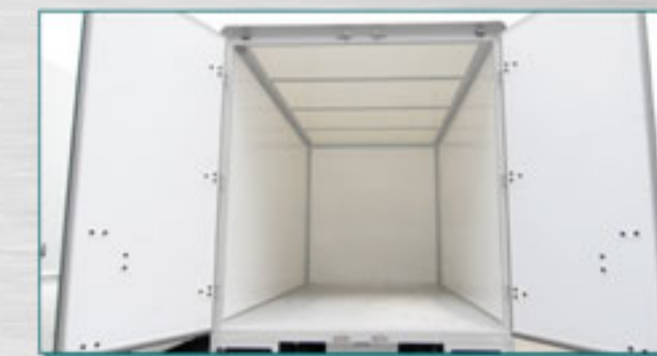
ความจุ 10.7 ลบ. ผนังเซมิเวียพาดแนล