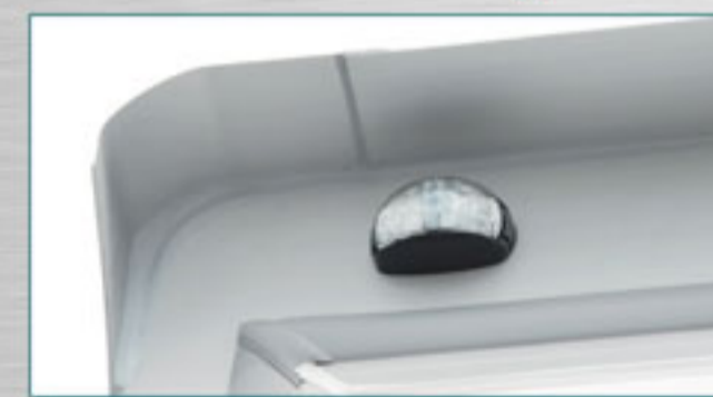
ไฟบอกความสูง LED. มาตรฐาน ADR จากออสเตรเลีย