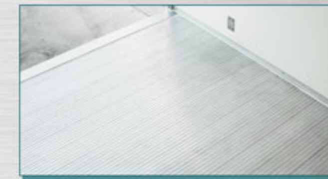
พื้นอลูมิเนียม extrusion