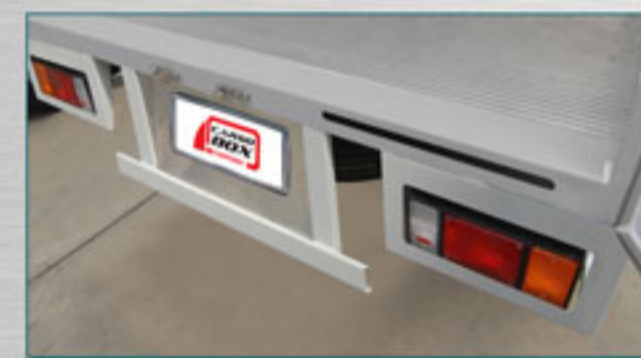
กันชนท้ายออกแบบกลมกลืนเป็นที่เหยียบ ภายในตัวแข็งแรง ทนทาน